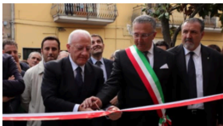
Il presidente De Luca ed il sindaco Verdone

Il Castello "Ettore Fieramosca" ha ripreso a vivere con un weekend ricco di visite e spettacoli, un momento storico che apre le porte a nuovi importanti progetti per il futuro di Mignano Monte Lungo e dell'intero territorio dell'Alto Casertano. Il taglio del nastro del Presidente della Giunta della Regione Campania, Vincenzo De Luca e del sindaco Antonio Verdone avvenuto sabato ha sancito la riapertura al pubblico del bene monumentale, dando il via alla cerimonia ufficiale di inaugurazione della struttura. Ad accogliere il corteo istituzionale, un'atmosfera di festa, grazie ai numerosi cittadini accorsi all'evento.